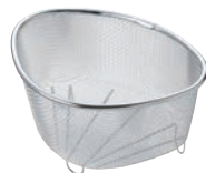
③18-8 三角コーナー 水きれ〜