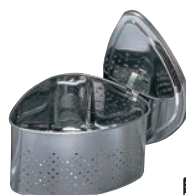
⑧抗菌ステンレス 蓋付 三角コーナー CK-114