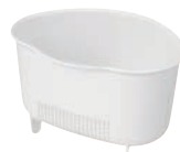
⑫クッキングパル 深型 三角コーナー L K-1344WH