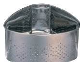
⑦抗菌ステンレス 三角コーナー CK-112