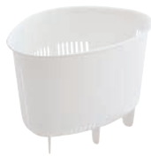
⑪H&H コーナーポケット ホワイト