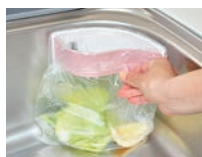
⑯水切り袋水きれくん (15枚入) 三角コーナー用

外寸:182×63×H70 材質:本体 / ポリプロピレン フタ / ポリエチレン 吸盤 / 塩化ビニール