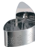
⑨抗菌ステンレス 圧縮蓋付 三角コーナー CK-115