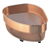
①ピュリティー 純銅 メッシュ 三角コーナー