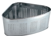
⑥UK 18-8 パンチング 三角コーナー