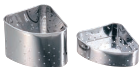
⑩AAA 18-0 三角コーナー